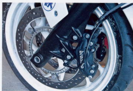
Bra men inte bäst. Skönast ABS av de två dock.

Helt klart är det en ganska behaglig känsla att bara hänga med och inte behöva koppla och växla. Automatlådan fungerar