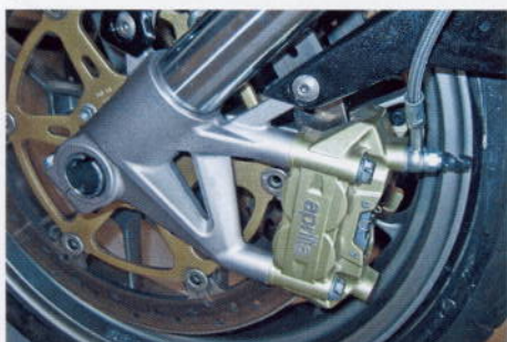
Som kolfiberbromsar på en Volvo. Överkurs, men så bra.

Designmässigt har dessa två skapat egna karaktärer. Budskapet på respektive märkes egna hemsidor talar egentligen sitt tydliga språk om vilka konsumenter man riktar sig