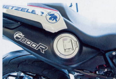
Fräckt att placera tanklocket på sidan. Så tyskt, så ostrikt.