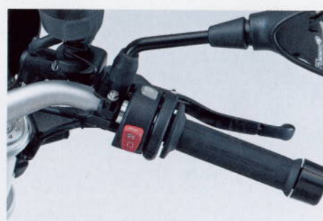
Tummen upp för värmehandtag som standard.